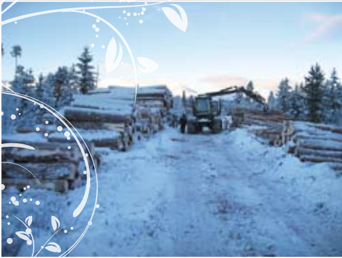
Drift hos flere eiere med flere sortiment stiller krav til lunneplass.