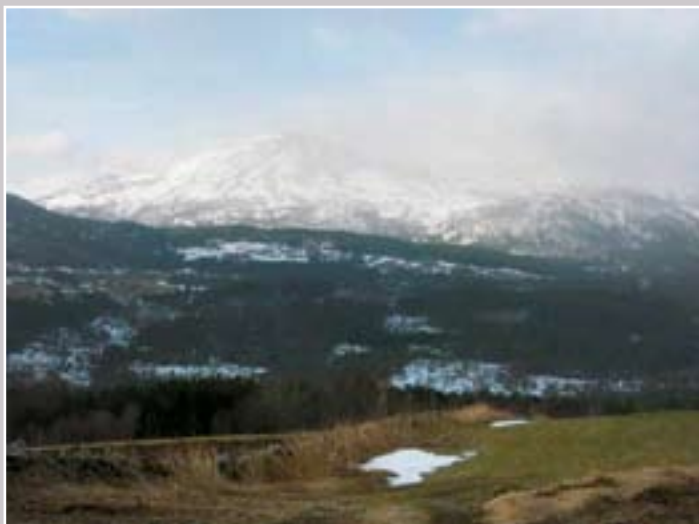
Den midtre del på bildet viser hvordan området ble etter hogsten.