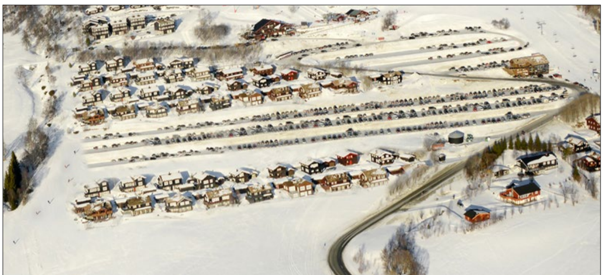
Figur 3. Bildeutsnittet viser området Vangslia. Manipulert til å vise forslag til framtidig plassering av parkering og fritidsbebyggelse.

Fordi alternativet kun berører områder som allerede er konsekvensutredet i høringsforslagets KU (BFR 15), og eksisterende fritidsbebyggelse i gjeldende plan, er det ikke gjennomført en ny KU.