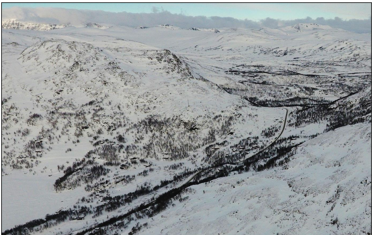
Figur 2. Dronebilde av fjellsiden ovenfor den nordvestlige delen av kartleggingsområdet (dvs. på vestsiden av Skarvatnet).