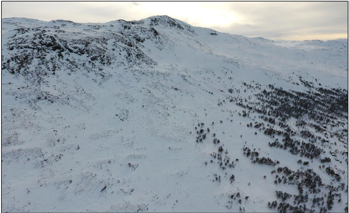
Figur 5. Dronebilde av vestsiden av Storgruvpiken, med mange mulige løsneområder for snøskred.