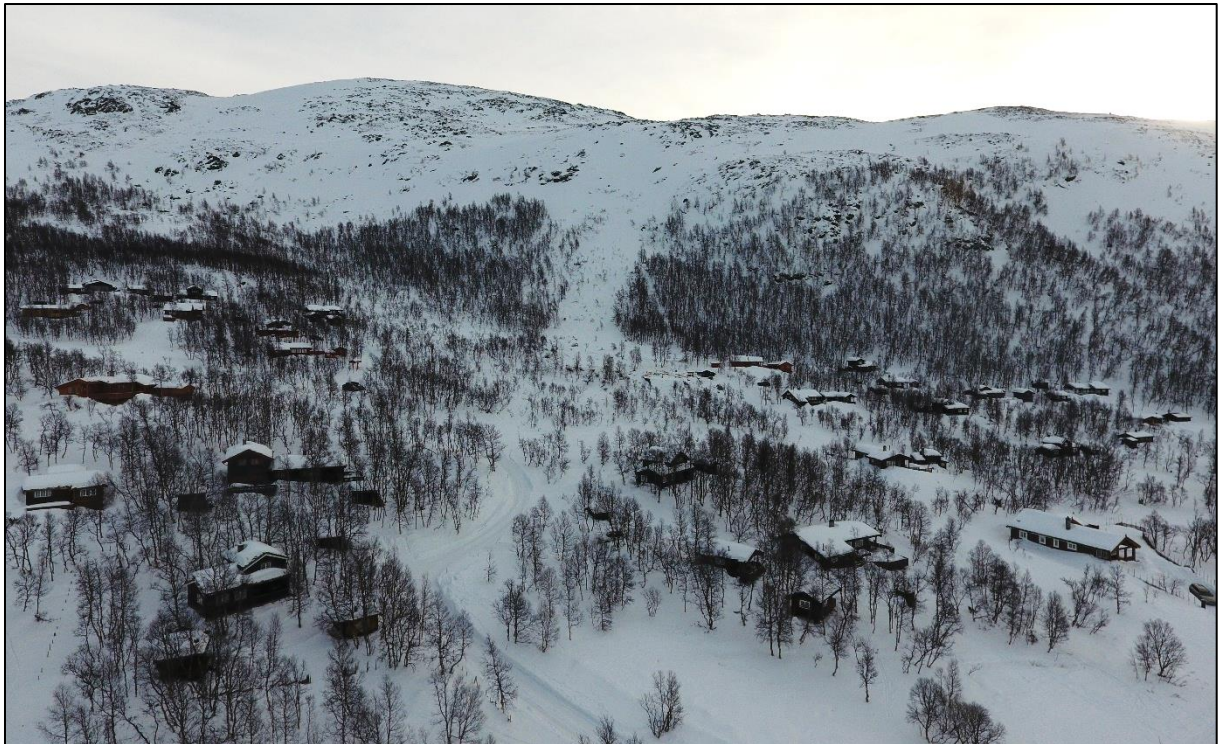
Figur 7. Dronebilde av fjellsiden ovenfor Grønli hyttefelt, med sporet etter snøskredet gått 15.1.18.