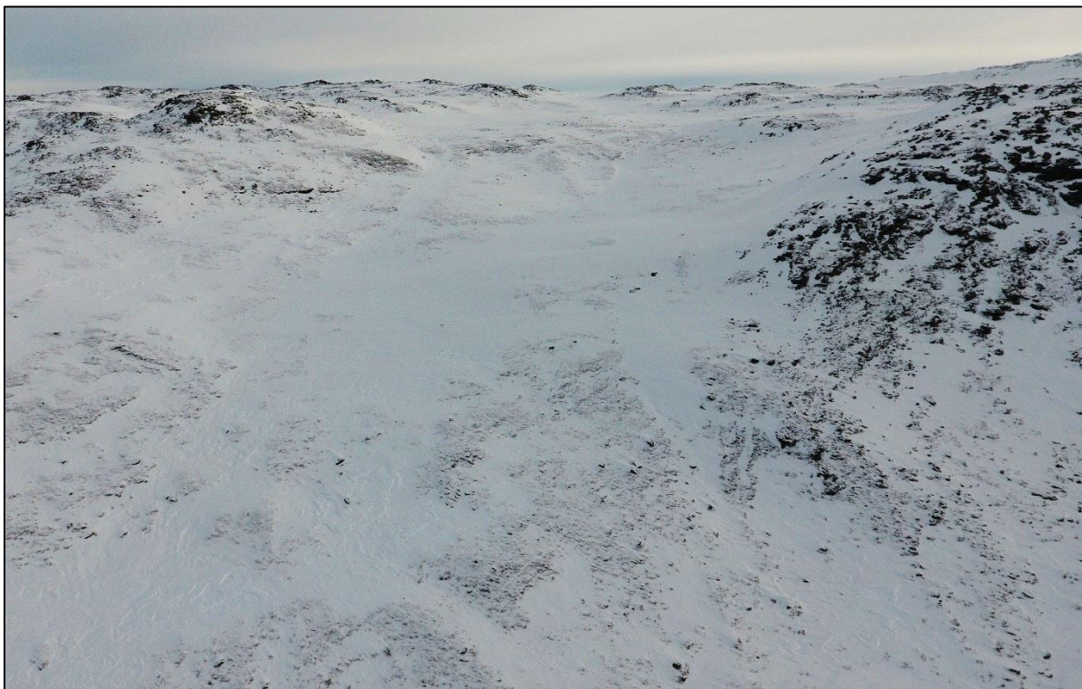
Figur 4. Dronebilde av det store nedslagsfeltet til Rembekken.