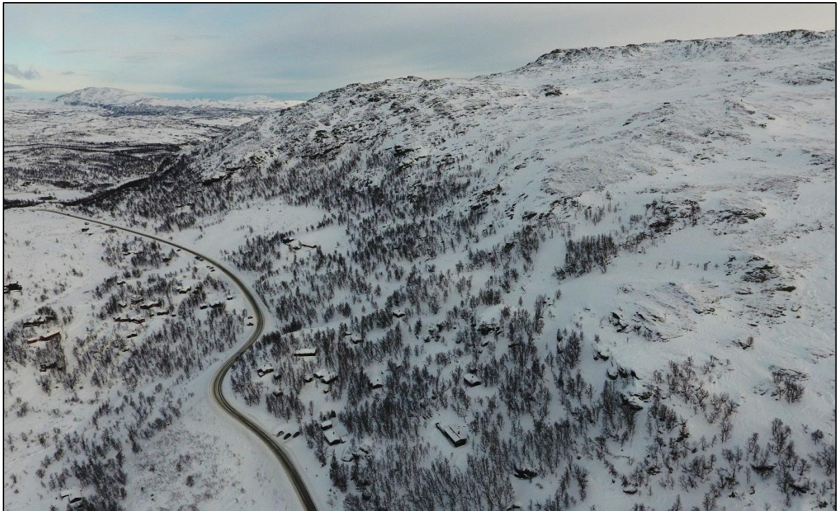
Figur 1. Dronebilde av fjellsiden ovenfor den nordøstlige delen av kartleggingsområdet.