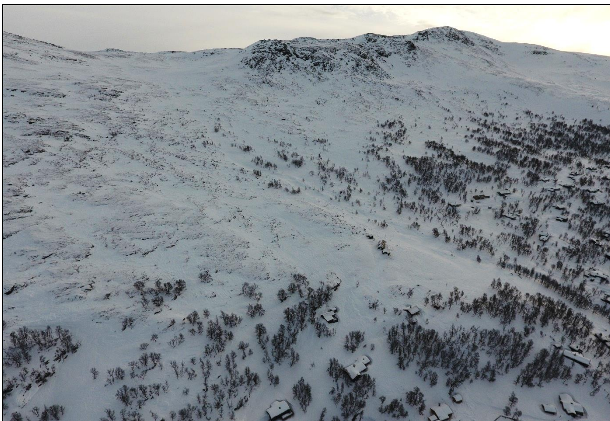
Figur 3. Dronebilde av øvre og midtre del av Rembekken.