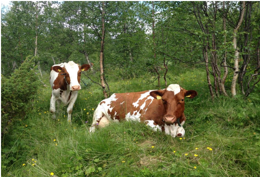
Kyr på seter i Gjevillvassdalen.

Oppdal kommune har størst jordbruksareal i fylket med 75 398 dekar i drift i 2017. (Dyrka jord og innmarksbeite). Oppdal er kommunen i Norge med mest innmarksbeite i areal.