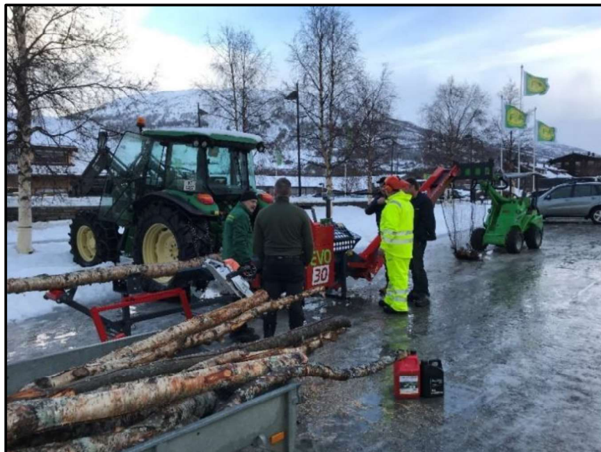
Bilde fra «Skog- og veddag» på Felleskjøpet avd. Oppdal.

Felleskjøpet har med sin solide finansielle stilling og sterke posisjoner i sine hovedmarkeder, et godt utgangspunkt for å utvikle selskapet videre. Hovedretningen i strategien ligger fast, og arbeidet med konsernets forbedringsprogram, Bondeløftet fase 2, følger de fastsatte målene. Styret har fokus på å styrke driften for å kunne foreta nødvendige investeringer slik at Felleskjøpet kan møte kundenes behov og endringer i markedene.