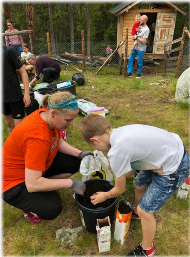
Potetsetting: Potetsetting i potetbøtter med Kløvermedlemmene i Paradiset 4H, Innset.