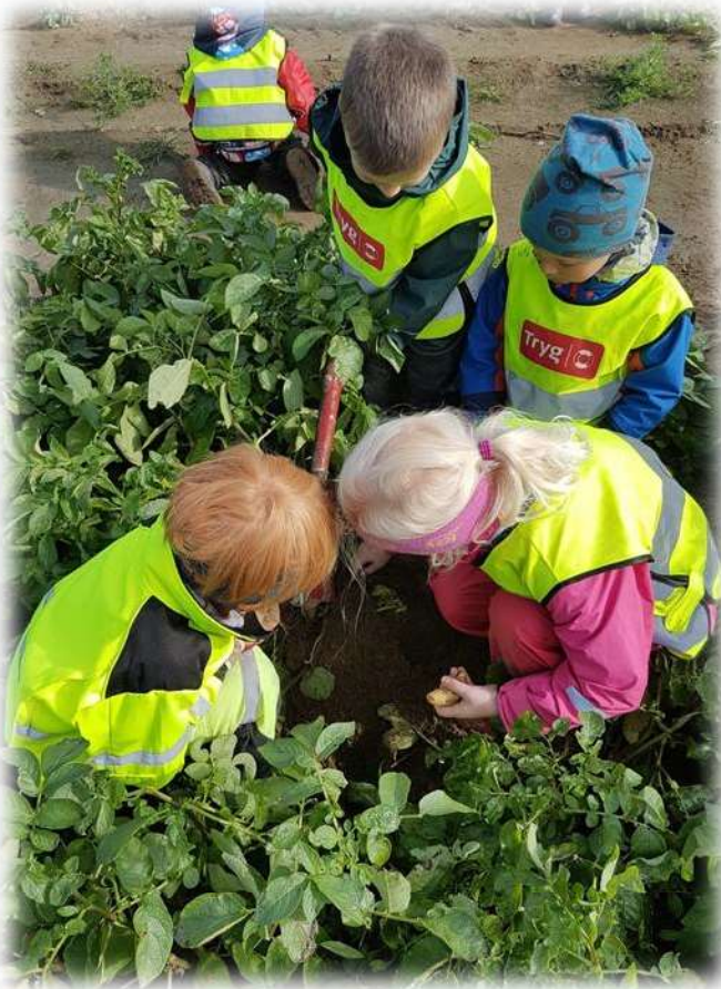
Potetopptaking: Svært ivrige potetplukkere med storbarnsavdelingen i Høgmo barnehage.