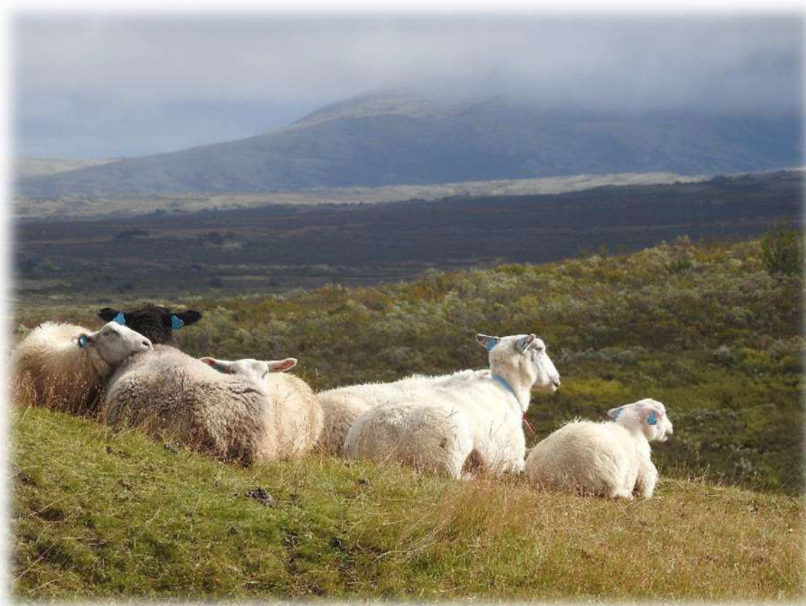
Avslappa sau på fjellbeite.