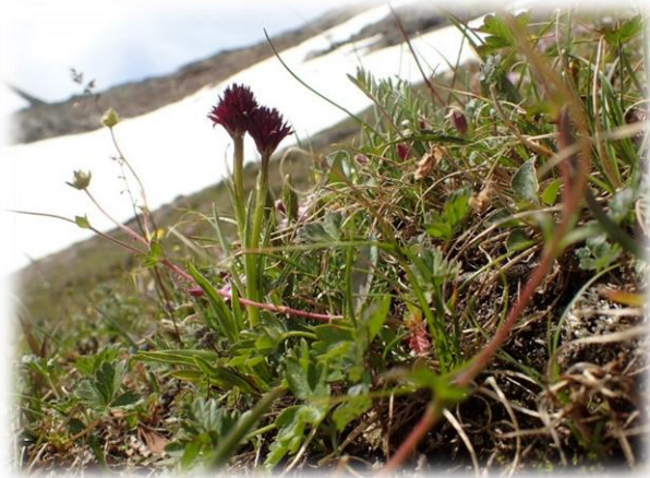
Svartkurle i Reinsbekkdalen.

Svartkurle- er en sterkt trua blomsterart, den finnes idag bare et titalls steder i Norge. Det ble i 2020 undersøkt 16 lokaliteter for svartkurle i Oppdal. Det ble av de gjort funn på 12 lokaliteter. Dette inkluderer også to steder i fjellet der det ikke blir gjort skjøtselstiltak. Grunneierne/beitebrukerne fikk samtidig veiledning av biolog John Bjarne Jordal om skjøtsel. Det ble talt opp i alt 675 blomstrende individer i 2020 mot 179 planter i blomst året før (2019 var et dårlig blomstringsår). Det har vært en jevn økning i antall blomstrende planter siden 2007. Grunneierne og andre sin store innsats med skjøtsel har gitt resultater for arten og Oppdal har trolig flere tusen individer, da det er bare en liten del av plantene som blomstrer. I følge Statsforvalteren i Trøndelag som har forvaltningsansvaret for svartkurle har Oppdal trolig største bestand i verden!! Grunneierne i Oppdal fikk i 2019 utarbeidet nye skjøtelsesplaner for de områdene der svartkurle er kjent. Å hindre beiting i blomstrings-tida og å unngå kunstgjødsel er helt nødvendig for å bevare arten. Blomstene skjermes derfor ved hjelp av nettingbur og gjerder. Disse fjernes etter frøspredning og det er viktig med god høstbeiting.