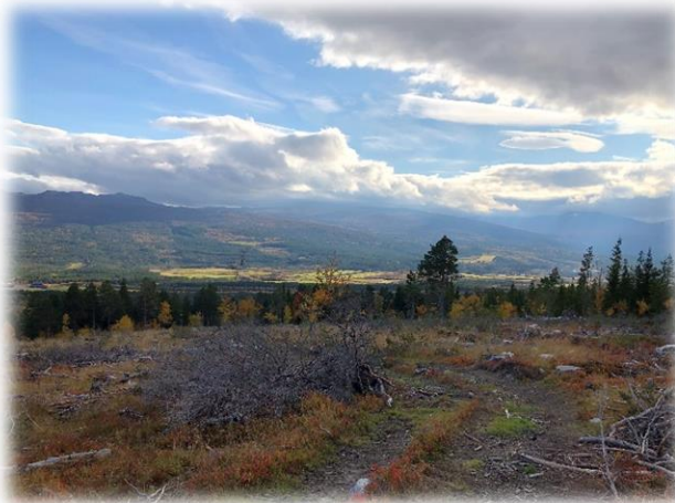
Nytt beite i Dännåliåsen.

I 2019 og 2020 har Innovasjon Norge ikke gitt tilskudd til sauefjøs. Det har i 2020 blitt bygd sauefjøs i Oppdal uten tilskudd, som ikke er med i denne oversikten.