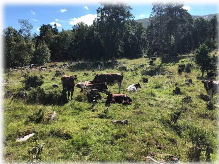
Nytt innmarksbeite er økt.

Vi ser at antall foretak med disponible kvote har gått ned med 19% i forhold til 2016, mens total melkekvote i Oppdal har gått ned med 4,5 % i samme periode.