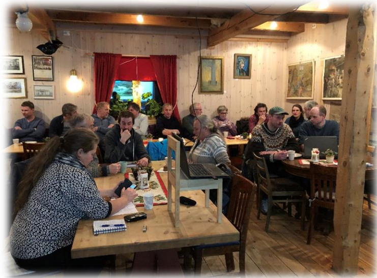
Fagdag naturbeitemark Vognildsbua.

Utarbeidelse av planene ble finansiert gjennom tilskudd fra Fylkesmannen i Trøndelag, og til Utvalgte Kulturlandskap da mange av slåttemarkene ligger innenfor UKL-området Klevgardan. Det er i dette arbeidet nykartlagt flere slåttemarker i Klevgardan. De fleste av disse grunneierne søker tilskudd til skjøtsel av slåttemark fra Miljødepartementet.