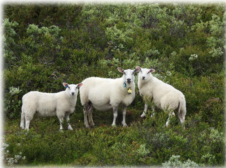
Sau på beite.