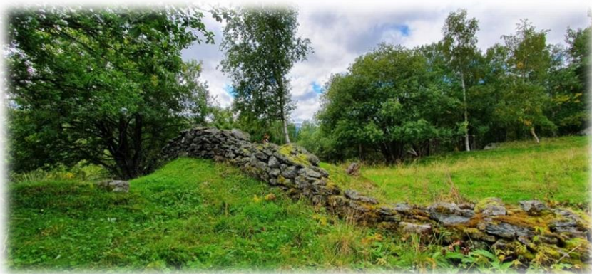
Steinutgard, et kulturminne.

Se http://gardskart.nibio.no/ for kart over din eiendom. Dersom du mener at noe av arealet er klassifisert feil – ta kontakt med landbruksforvaltningen!