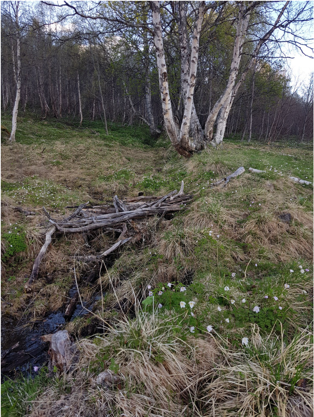
Fig. 4: Viser samlegrøft for å fange opp vann fra vannsig i området. Dette er gjort av hensyn til dyrkamark på nedsiden.