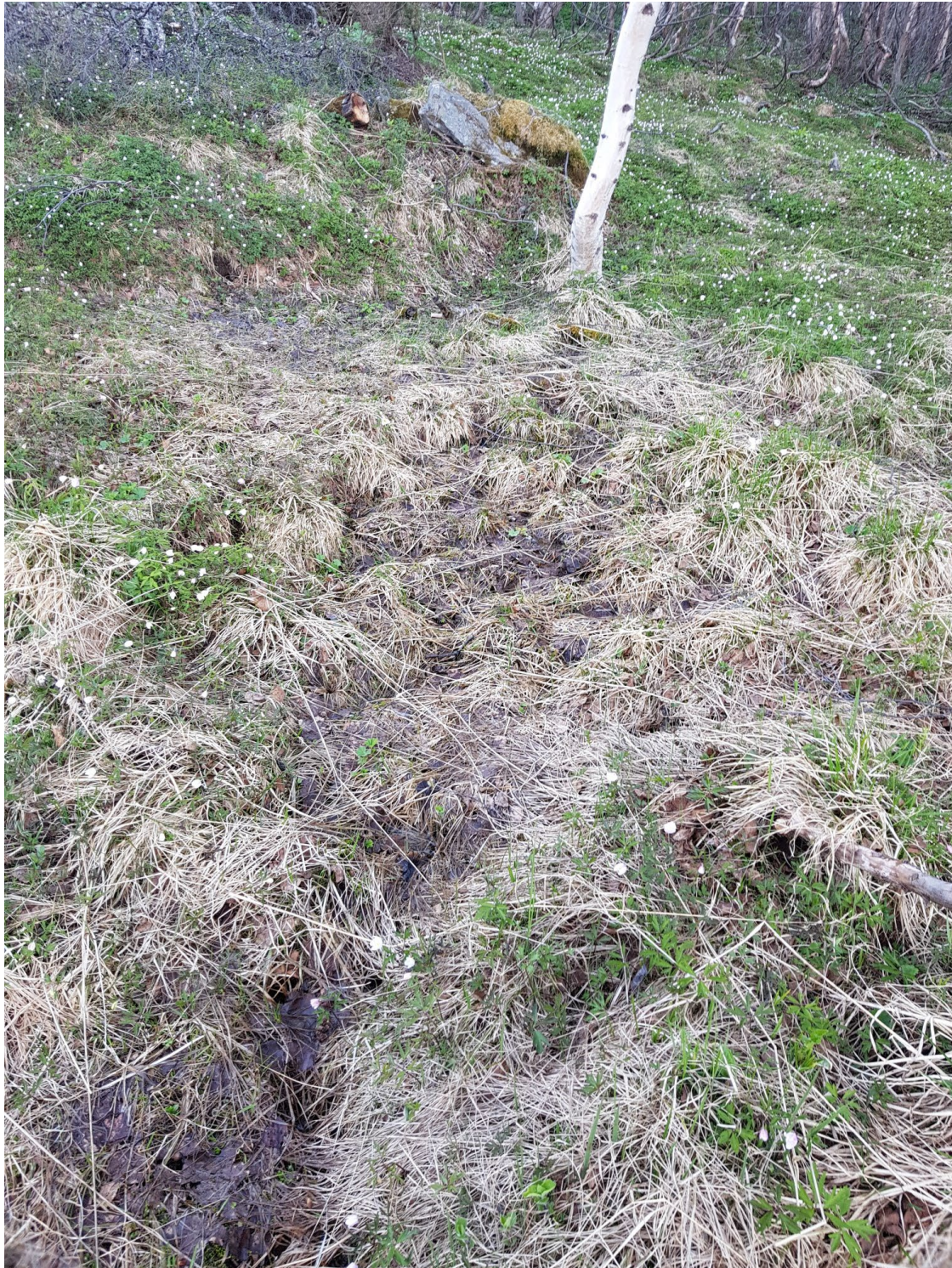
Fig. 3: Viser vannsig som er avmerket på kart