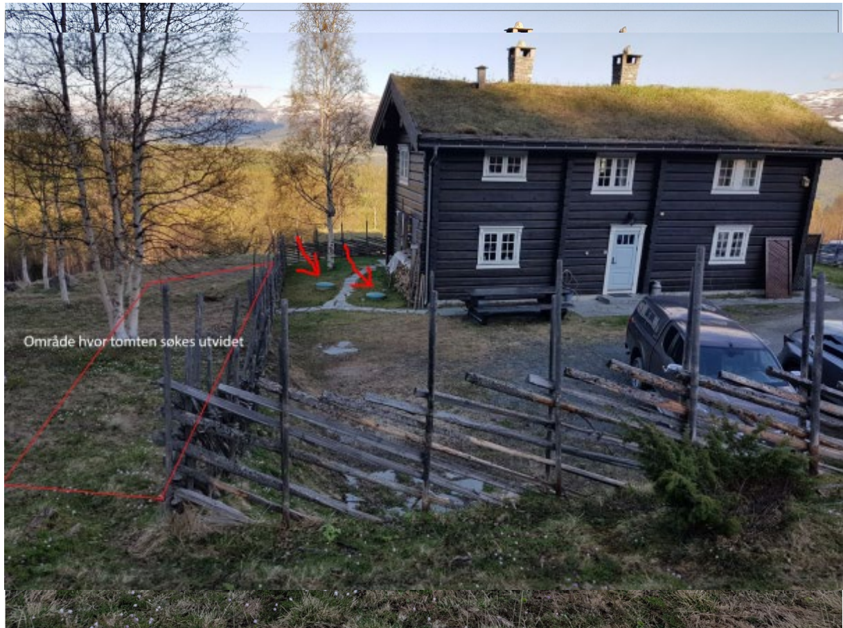
Fig. 5: foreslått tomteutvidelse – gnr/bnr. 188/37.