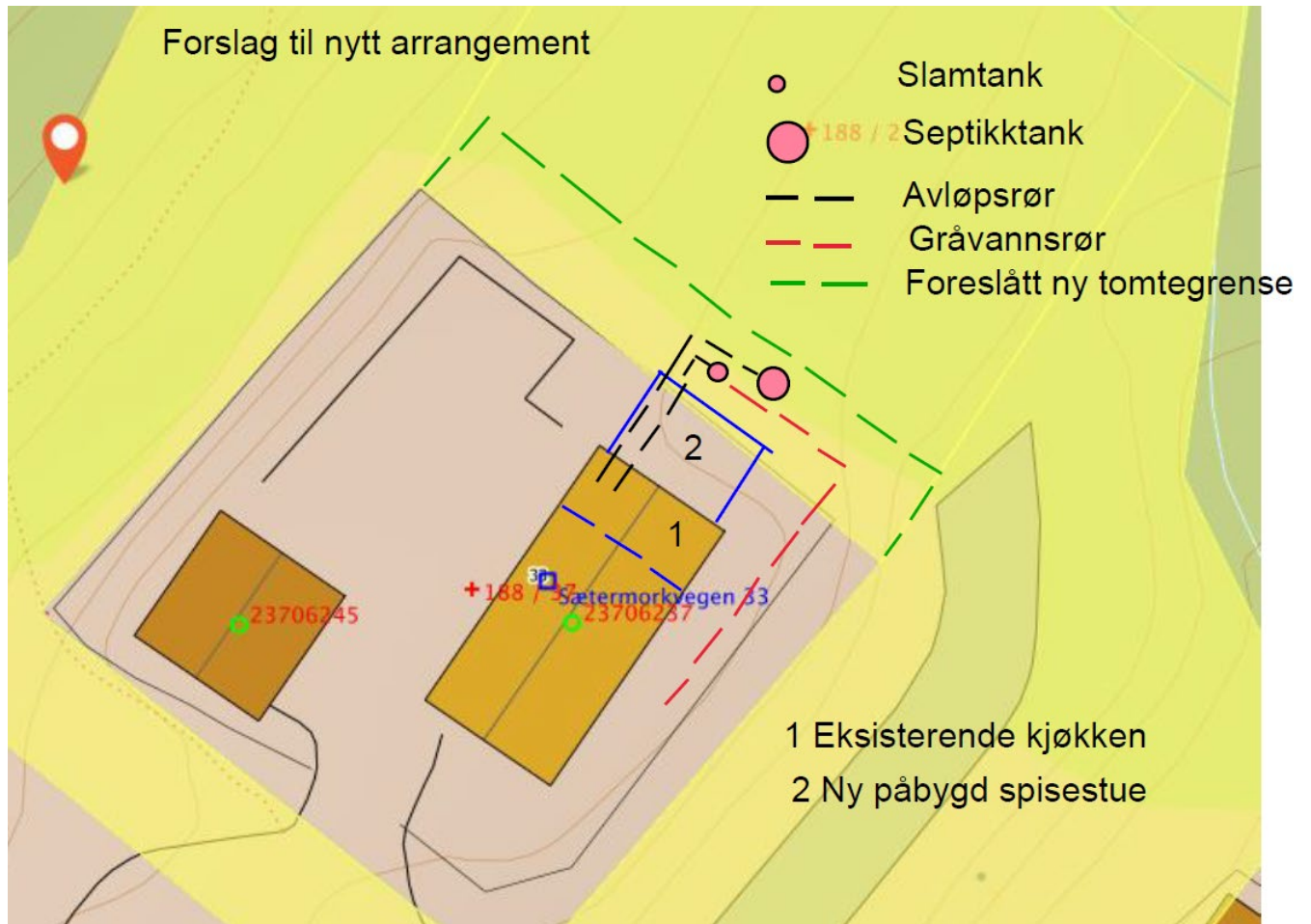
Fig. 2: Viser forslag til tomteutvidelse, samt ny plassering slamtank og septiktank.