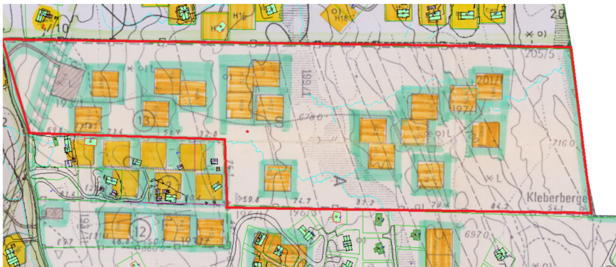
Figur 2: Utsnitt av gjeldende reguleringsplan med ny plangrense markert i rødt.

Planforslaget ble lagt frem for førstegangs behandling i utvalgsmøte 25.04.2023. I saken ble det fra kommunedirektørens side foreslått å legge planen ut på høring, med betydelige endringer i antall tomter, og noen endringer i bestemmelsene. Utvalget vedtok å ta ut ytterligere tomter, og la deretter planforslaget ut på høring. I ettertid ser kommunedirektøren at vedtaket utgjør såpass store endringer fra innsendt planforslag uten at dette var gjort i samråd med forslagsstiller, at vedtaket er å betrakte som et avslag. Kommunedirektøren legger derfor saken frem for ny behandling i kommunestyret jf. pbl. § 12-11 siste setning. Kommunedirektøren har hatt dialog med forslagsstiller om den opprinnelige tilrådingen, og tilrådingen i foreliggende sak er nå gjort i samråd med forslagsstiller. Tilrådingen oppfyller med dette kravene til saksbehandling av private planforslag.