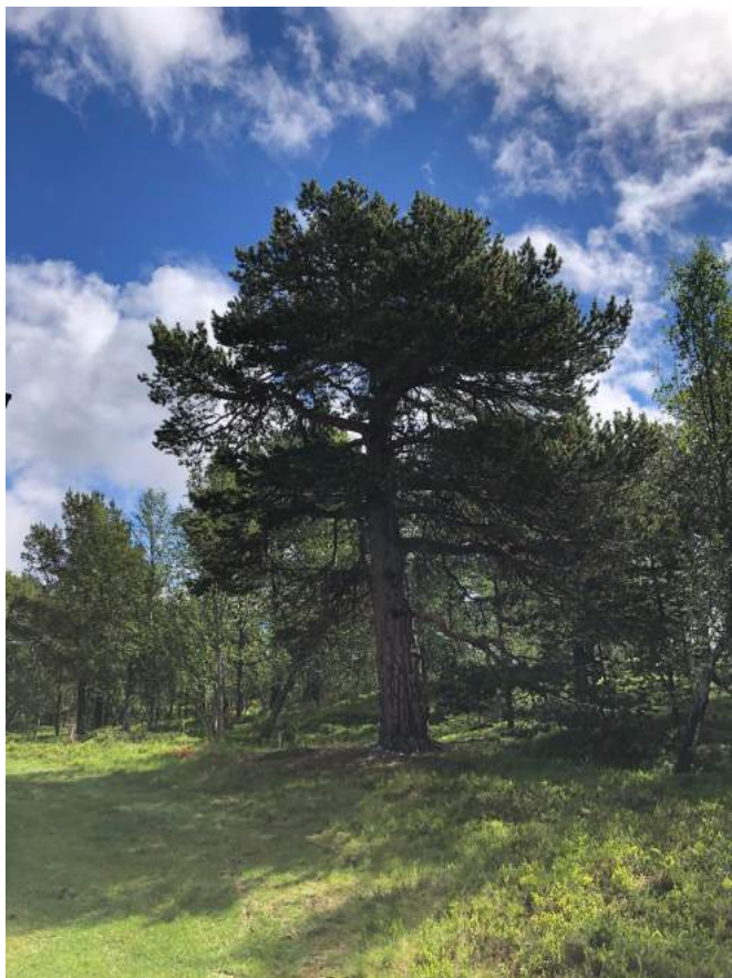
Figur 10 Området sør og øst for Fjellskolen er blandingsskog med blant annet furu