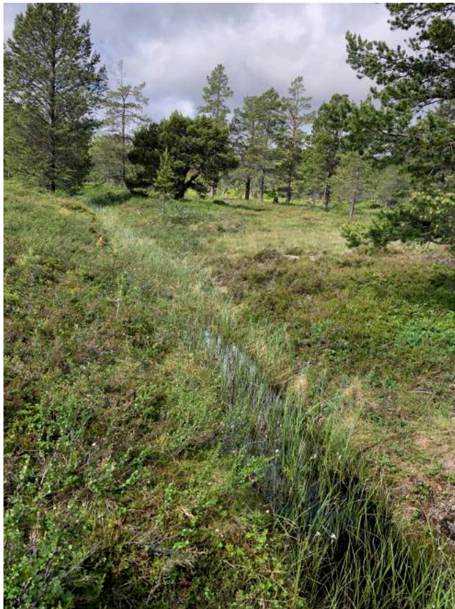
Figur 9 Bilde som viser bekken som renner i nordøstre del av tomta