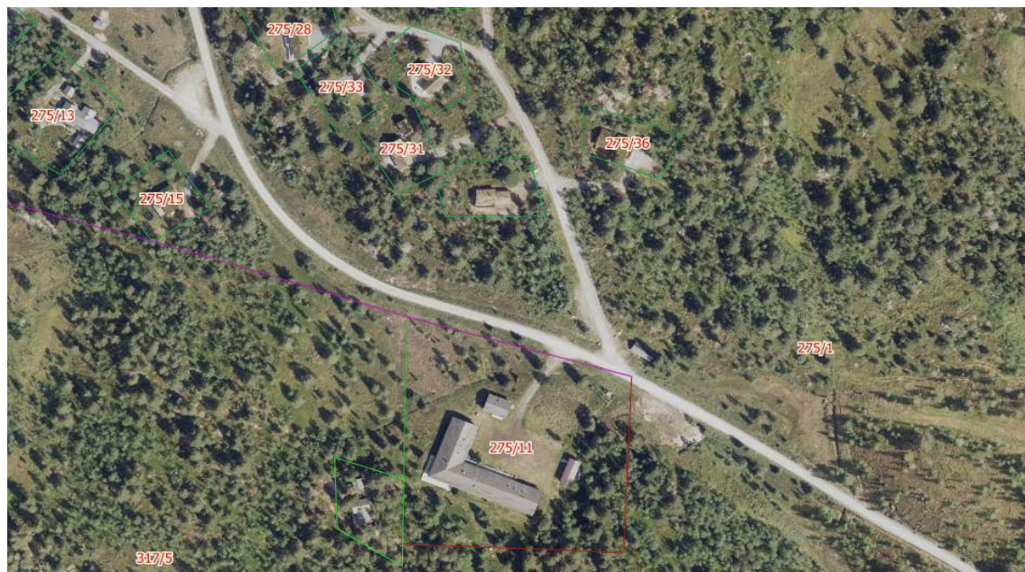
Figur 1 Flyfoto med tomtegrenser

Vi viser til tidligere sendt planforespørsel, datert 18.11.2022. På vegne av Fjellskolen AS anmoder vi med dette om oppstart av detaljregulering for Den gamle Fjellskolen i Oppdal Kommune (Gnr/Bnr. 275/11).