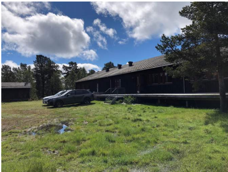
Figur 8 Bløte områder nord for Fjellskolen. Bilde fra befarings juli 2022