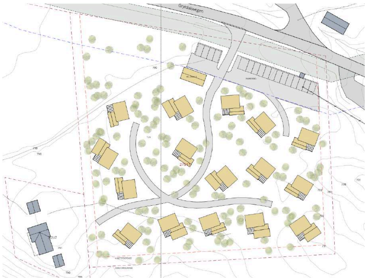
Figur 3 Illustrasjonsplan som viser 16 enheter.