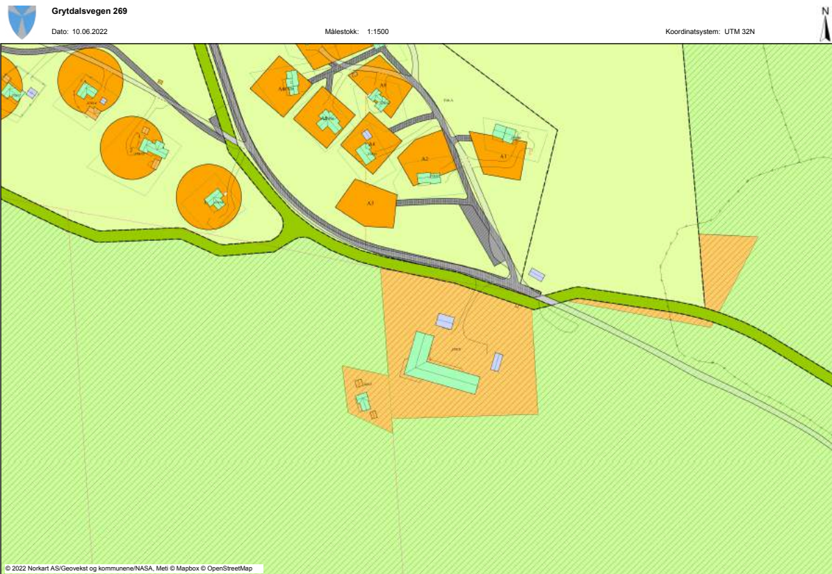
Figur 2 Utsnitt fra Kommuneplanens arealdel, hvor tomten er vist som nåværende fritidsbebyggelse. De grønne arealene er vist som nåværende LNFR-areal, område med skravur er hensynssone reindrift, mørkegrønn er nåværende skiløype og lysegrønn er område for jord