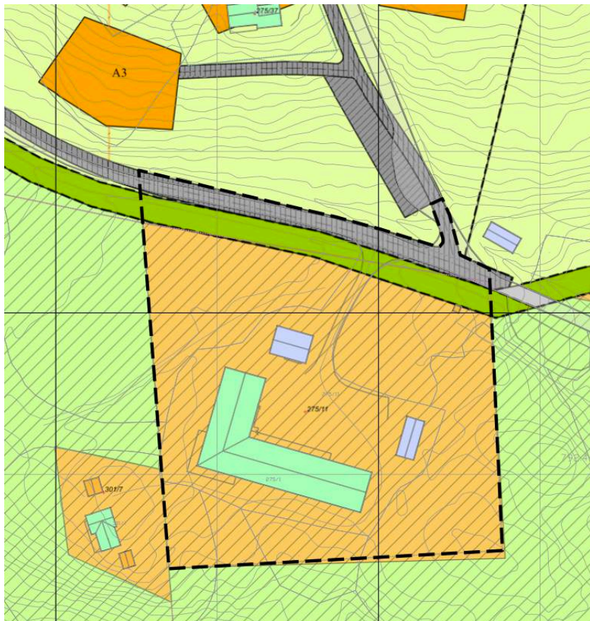
Figur 4 Forslag til planavgrensning