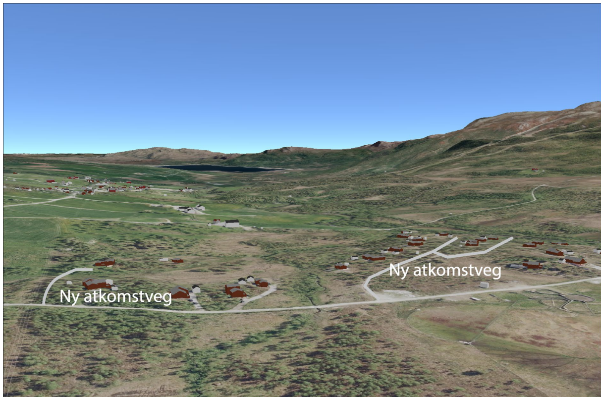
Fig. 3: Forslag til nye atkomstveger vist på 3D bilde