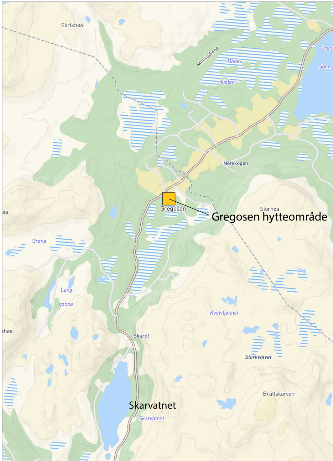
Fig. 1: Oversiktskart

På vegne av tiltakshavere Frode Andersen og Ole Johan Svorkdal oversendes en forespørsel om oppstart av arbeid med endring av detaljreguleringsplan for Gregosen hyttefelt, del av gnr/bnr. 328/1.