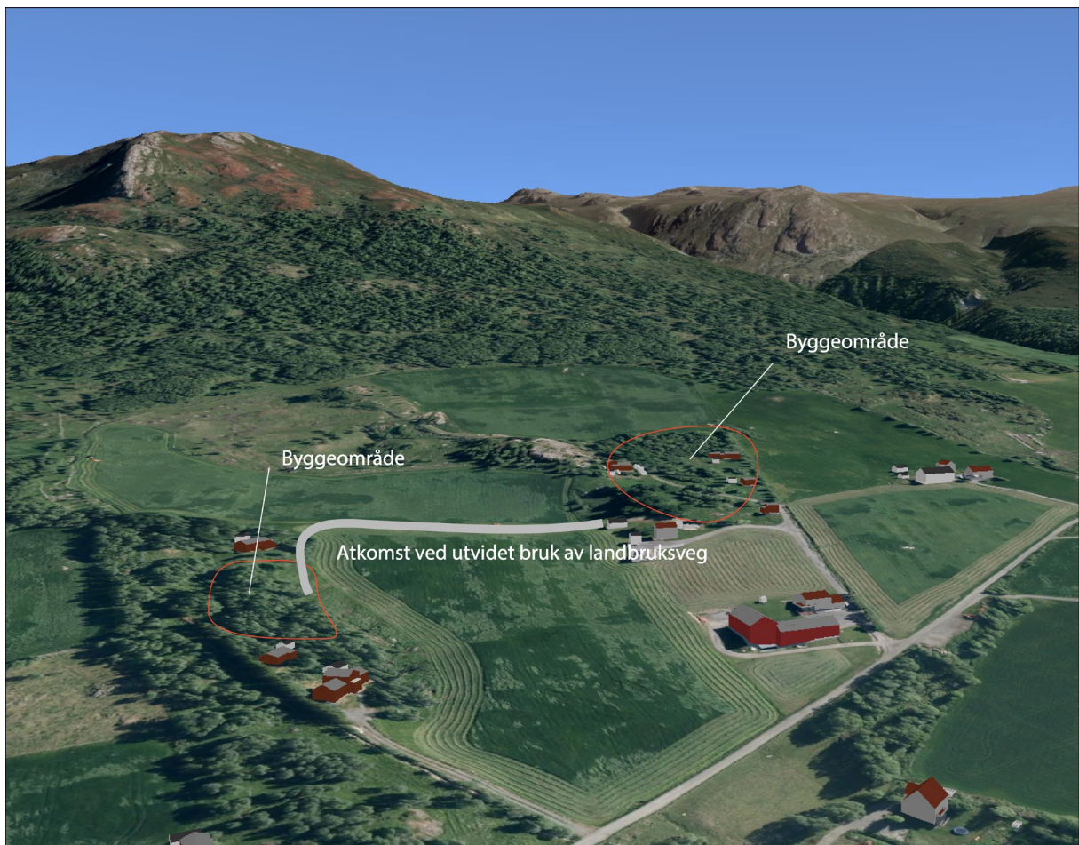
Fig. 4: Viser tenkt plassering av ny bebyggelse i forhold til omgivelsene.