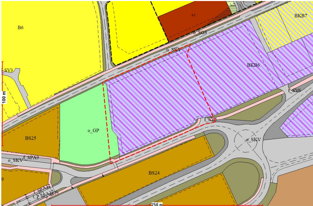
Figur 4. Utsnitt gjeldende reguleringsplaner