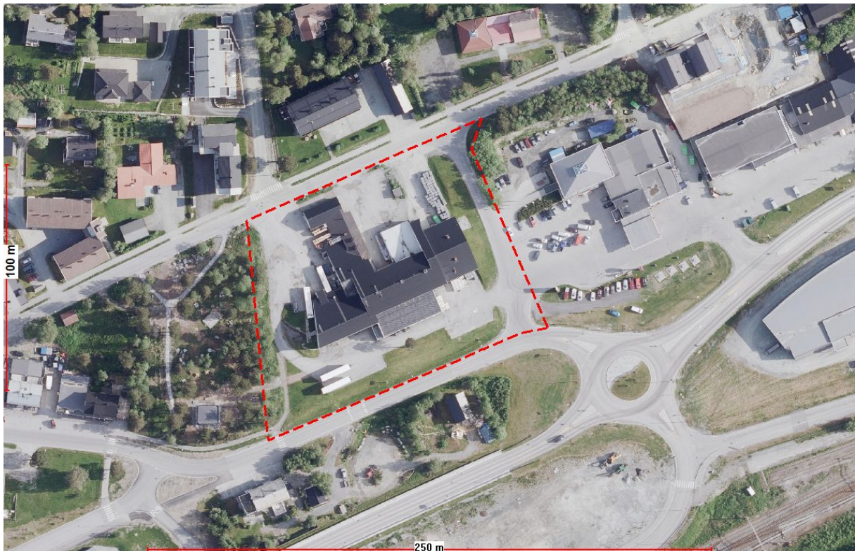
Figur 5. Utsnitt ortofoto.