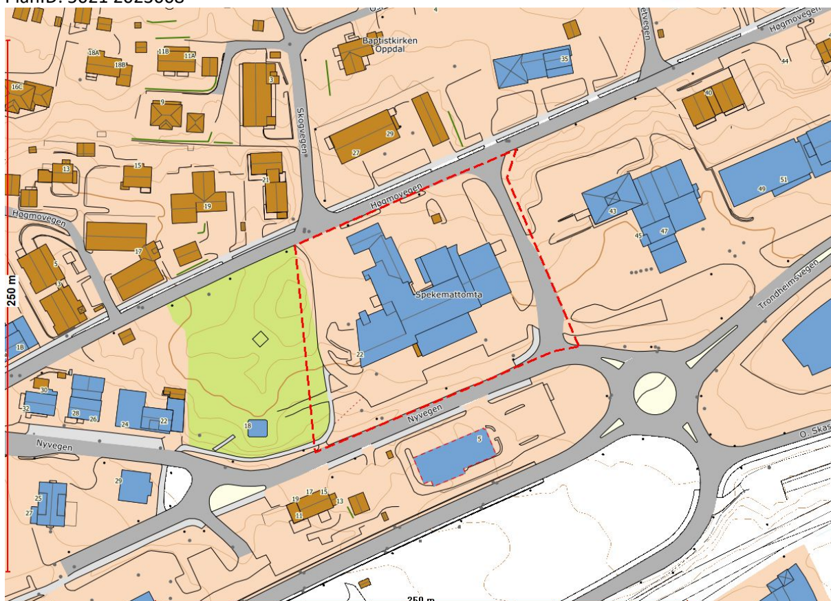
Figur 2. Planavgrensning (rød stiplet linje)