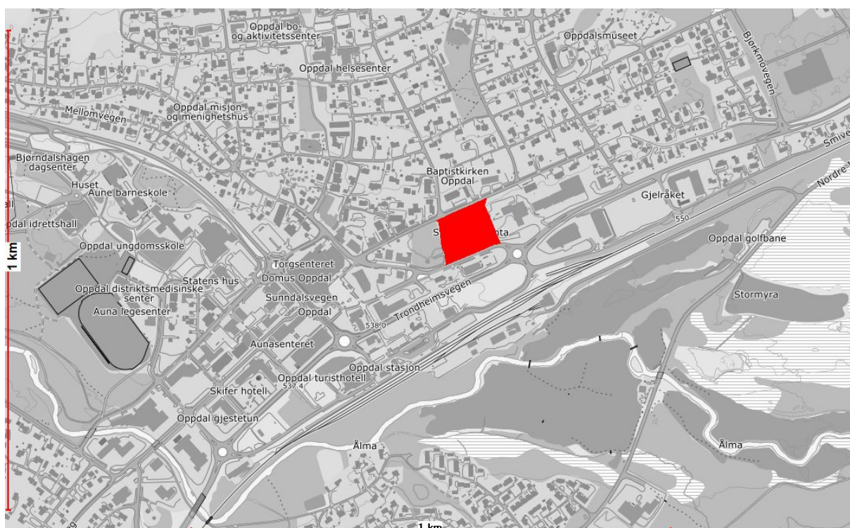
Figur 1. Oversiktskart