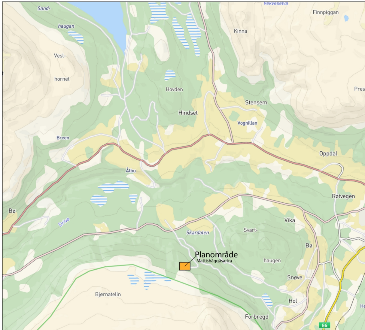
Fig. 1: Oversiktskart.

I medhold av Plan -og bygningsloven § 12-8 og på vegne av tiltakshaver Knut Tørstad varsles det om oppstart av arbeid med detaljreguleringsplan for Mattishåggåsætra, dette vil være endring av en eldre reguleringsplan for SNEVE, gnr/bnr. 92/1.