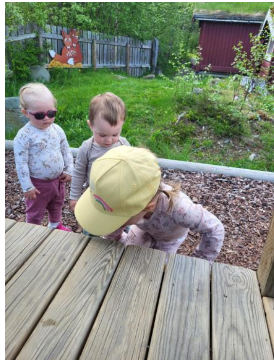
Å vente på turen sin er en god sosial kompetanse.